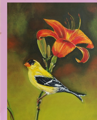
Peinture de Monique Brideau