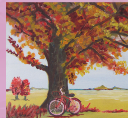
Peinture de Jacques Comeau

Centre socio-culturel Académie Ste-Famille Tracadie, NB